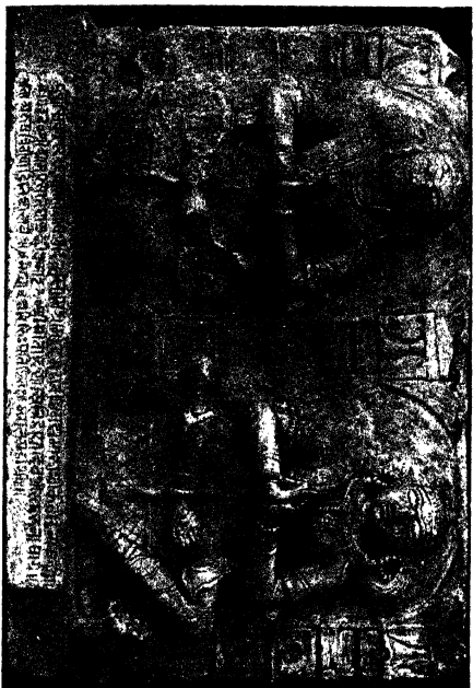
The Minister Ambaprasada with his wife Sitadevi